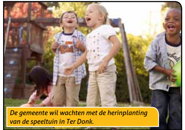
De gemeente wil wachten met de herinplanting van de speeltuin in Ter Donk.

Volgens raadslid Inne Beckers wordt van de gelegenheid best gebruik gemaakt om de speeltuin opnieuw in te planten. Eerder onderzoek wees immers uit dat de huidige inplanting van deze speeltuin de nodige problemen met zich meebrengt. Renovatie ervan is bijgevolg weggegooid geld. De meerderheid acht het qua timing niet haalbaar om de herinplanting van de speeltuin te combineren met de heraanleg van de parking. Deze problematiek is nochtans al lang gekend.