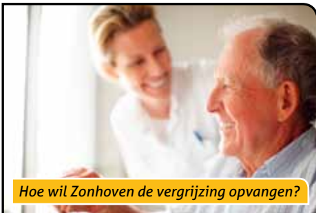
Hoe wil Zonhoven de vergrijzing opvangen?

Het meerjarenplan mist elke visie en geeft geen enkele invulling aan de uitdagingen aangeduid in de eigen omgevingsanalyse. Volgende proble-